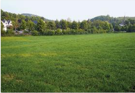
„Schulden Wiese“, Blickrichtung Hauptstraße, rechts die katholische Kirche

sen Voraussetzungen zustimmen, die sich konkret auch in den Eingaben der Bürgerinnen und Bürger widerspiegeln.