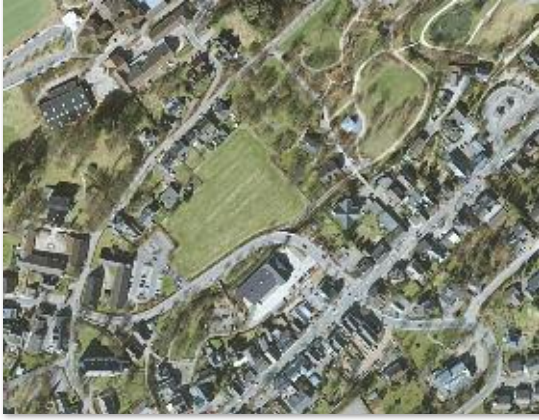
Luftbild des Bereichs Tölckestraße